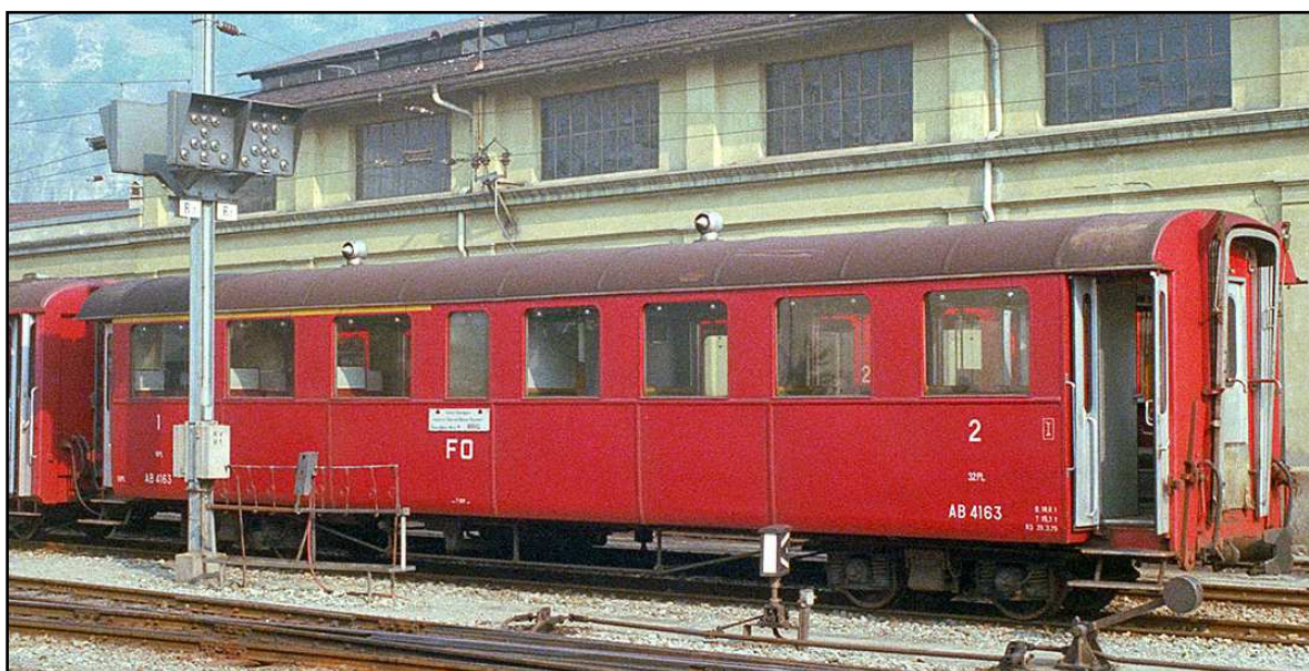
Der AB 4163 abgestellt in Brig; undatiert