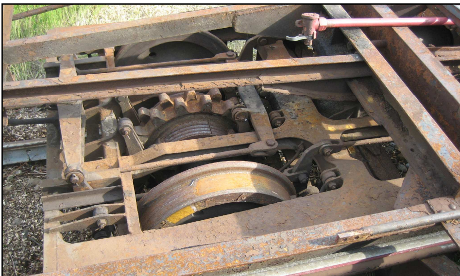
Das Drehgestell mit Bremszahnrad vor der Zerlegung

Da die DFB nur Polsterbestuhlung in der Anordnung 2+1 in der 1. Klasse und Holzbänke in der Anordnung 2+2 in der 2.Klasse kennt, wird mit diesem Wagen in der glei-