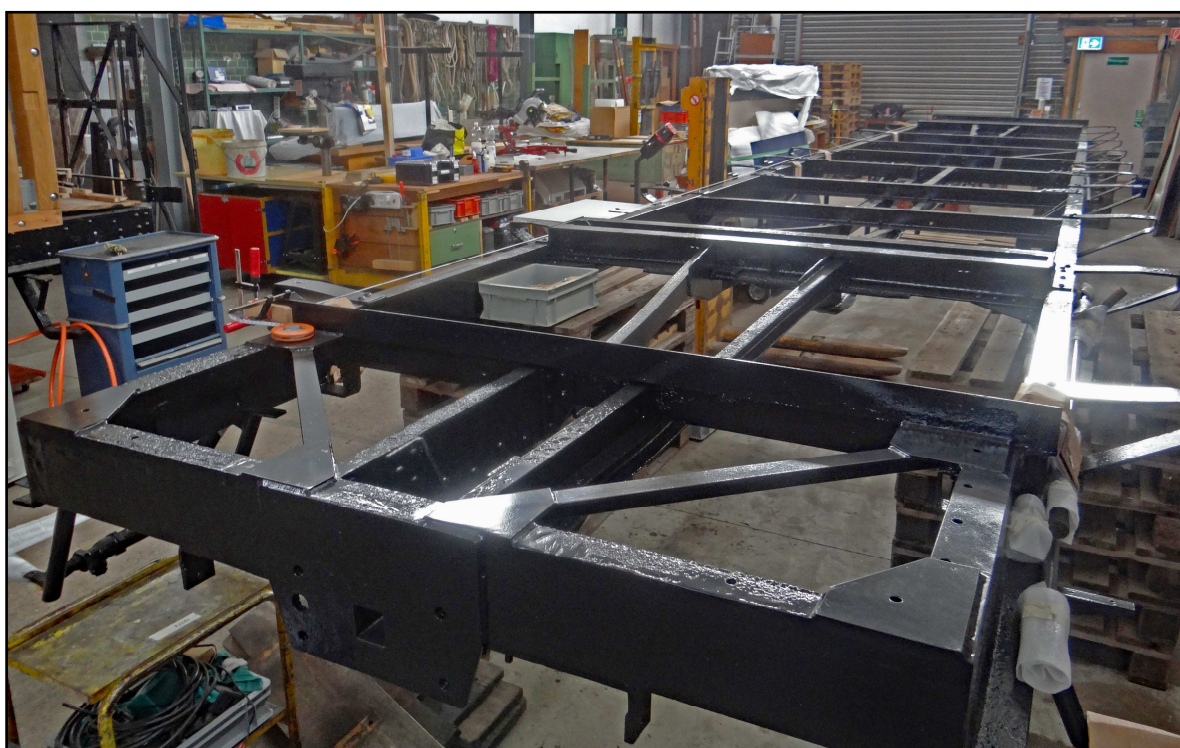
Das revidierte Chassis in der Wagenwerkstatt