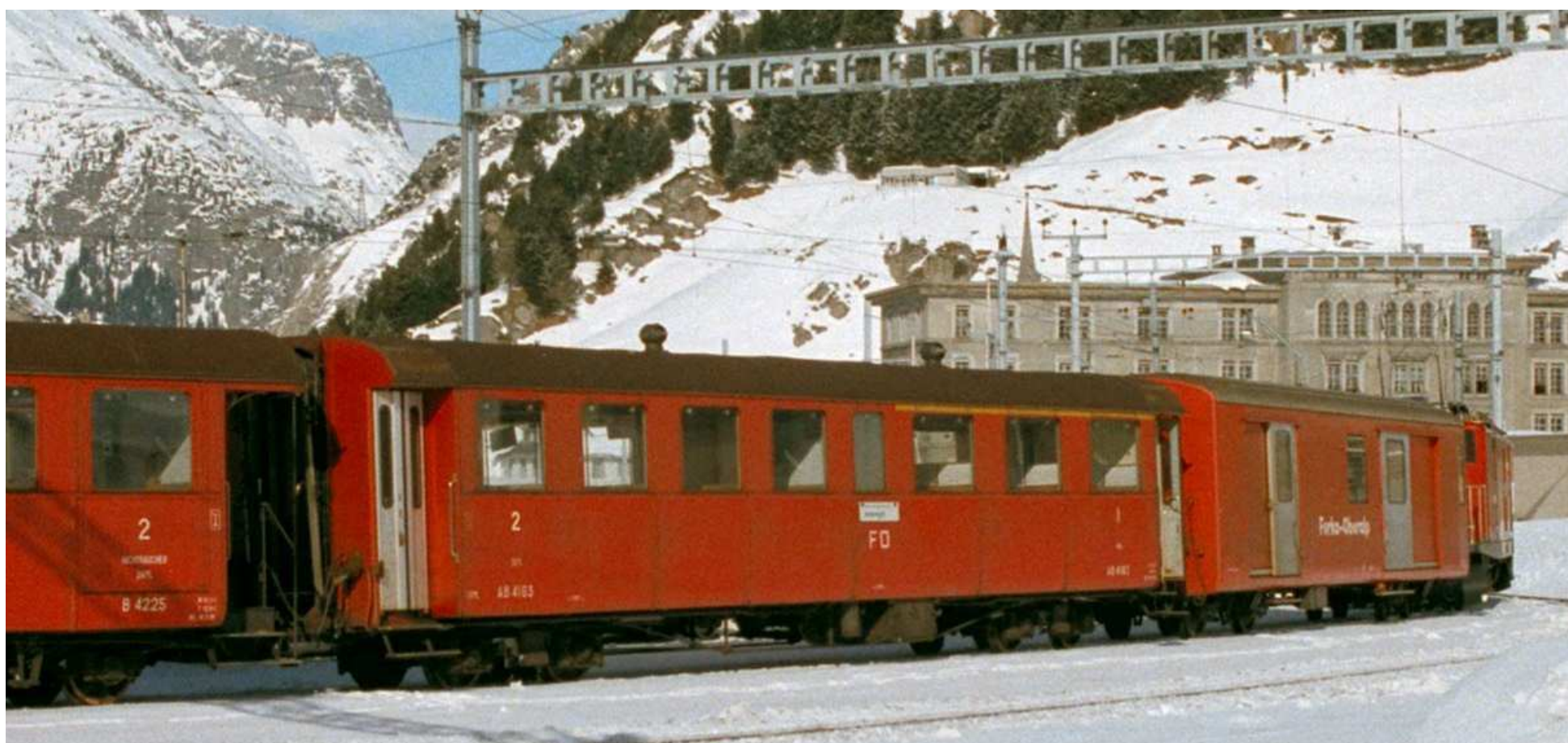
Der AB 4163 in Andermatt 1985

Bei dieser Wagenrevision des dritten originalen FO - Vierachser für die DFB handelt es sich um die 20. Revision in der Wagenwerkstatt Aarau. Es geht um die Totalrevision des Rahmens (Chassis) mit Drehgestellen und um den Neuaufbau des Kastens mit allen Einzelteilen und der gesamten Inneneinrichtung. Vom abgebrochenen originalen Kasten sind nur wenige Einzelteile vorhanden und brauchbar.