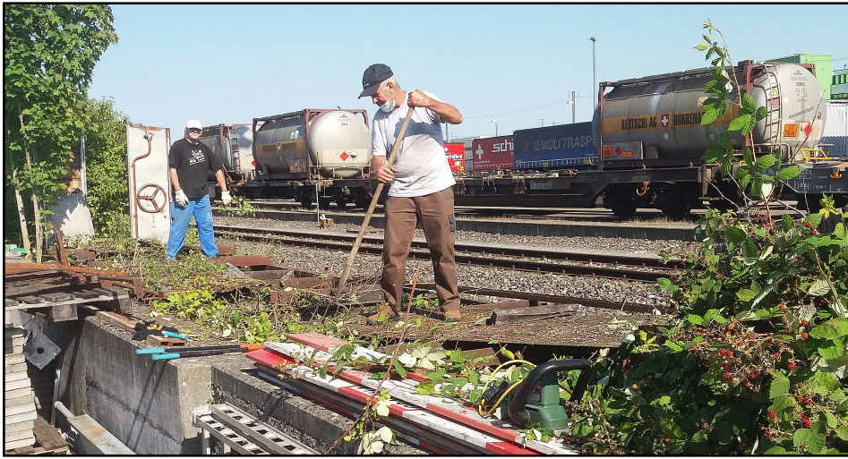
Freilegen des überwucherten Chassis am 30.7.2020

zu Josef Meyer Rails gebracht, die es sandstrahlten, alle Reparatur-Schweissarbeiten ausführten, umfassend prüften, grundierten und den schwarzen Decklack aufbrachten. Seit 22.09.2021 steht es wieder in der Wagenhalle.