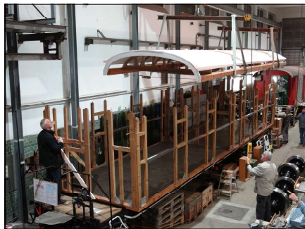
Das vormontierte Dach schwebt auf das tragende Gerippe des Wagenkastens

neuer Kasten gemäss den Originalplänen gebaut. Alle Holzteile dafür haben die Mitarbeiter der Wagenwerkstatt neu gefertigt: Eine aufwendige Arbeit, die eine gute Arbeitsvorbereitung und hohe Präzision erforderte, damit am Ende alle Teile genau zusammenpassten. Tag der Wahrheit war der 24. November 2015, an dem in weniger als zwei Stunden das Dach auf die unzähligen Pfosten des Wagenkastens aufgesetzt wurde.