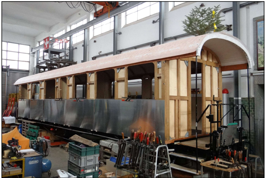
Der AB 4462 in der Wagenwerkstatt Aarau mit aufgesetztem Dach und ersten probeweise angeschlagenen Blechen.

Nachdem der alte Wagenkasten abgebrochen war, wurde ein komplett