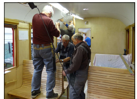
Schlussmontagen in der 2. Klasse: Bänke, Gepäckträger und eine Unzahl von Abdeckleisten

Neu gefertigt wurden unter anderem die Dampfheizung, die elektrische Ausrüstung für die Beleuchtung mit Generator und Akku und eine Lautsprecheranlage.