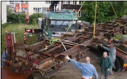
Der Wagenrahmen wird zur Revision vom Zwischenlager geholt

Ein wesentlicher Unterschied ist die Einteilung der Abteile und die Ausrüstung mit Sitzplätzen. 1914 galt noch das Drei-Klassen-System mit der 1. Klasse in 1+2-Bestuhlung gepolstert, der 2. Klasse mit 2+2-Bestuhlung gepolstert und der 3. Klasse mit 2+2-Bestuhlung Holz. Der AB 4462 hat anstelle der Sitze 1. und 2. Klasse des AB 453 18 Sitzplätze 1. Klasse gepolstert und 28 Sitzplätze 2. Klasse Holz.