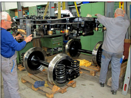
Aufsetzen des revidierten Drehgestellrahmens auf die neu bandagierten Radsätze

Der Bodenrahmen, alle Teile des Bremssystems und die Drehgestelle wurden von Grund auf revidiert, d.h. zerlegt, alle Teile gereinigt, überprüft, wo erforderlich überarbeitet oder ersetzt, mit Schutzanstrich versehen und wieder zusammengebaut. Die Räder der Drehgestelle wurden neu bandagiert und die Bremszahnräder und Bremsstromeln durch neue ersetzt.