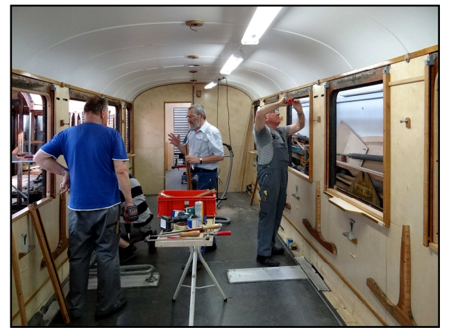
Innenausbau wie neu