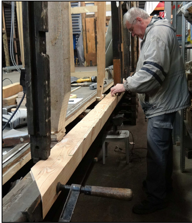
Ersatz eines vermoderten Teiles des Bodenbalkens