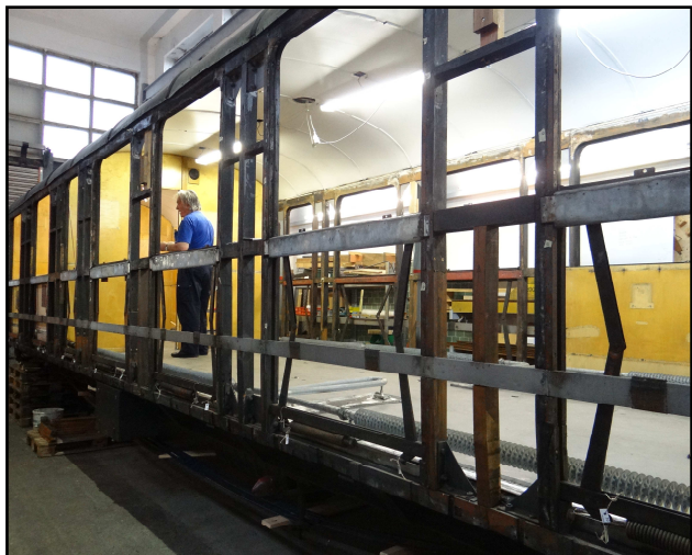
Der Kasten des AB 4453 wurde ausgeräumt und ausgebleicht

Die beiden Drehgestelle wurden komplett zerlegt, gereinigt und neu lackiert. Alle Federpakete sind zerlegt und neu gefettet worden, alle Schraubenfedern an den Achslagern durch neue ersetzt. Die Gleitflächen der Drehgestelle und der Federung wurden durch wartungsfreie Kunststoffgleitflächen ersetzt.