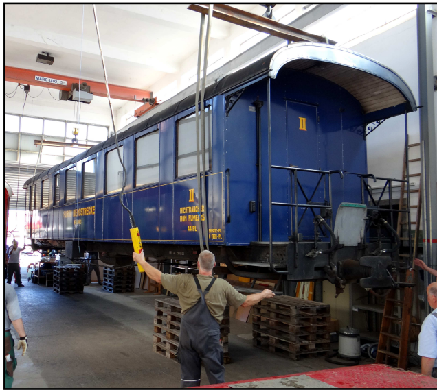
Ankunft des AB 4453 in der Wagenwerkstatt Aarau

Der AB 4453 war nach einer Totalrevision in der Wagenwerkstatt Aarau im Jahr 2000 der Dampfbahn Furka-Bergstrecke als B 4253 (alle Sitzplätze 2. Klasse) für den Fahreinsatz abgeliefert worden. 2008 wurde das kleinere Abteil mit Sitzen 1. Klasse ausgerüstet, um der Nachfrage zu entsprechen. Dies führte zur Umbezeichnung in AB 4453. Nach 16 Jahren Einsatz auf der Bergstrecke - ganzjährig dem rauen Bergklima ungeschützt ausgesetzt - wurde es nötig, den Wagen grundlegend zu revidieren (Revision R4).